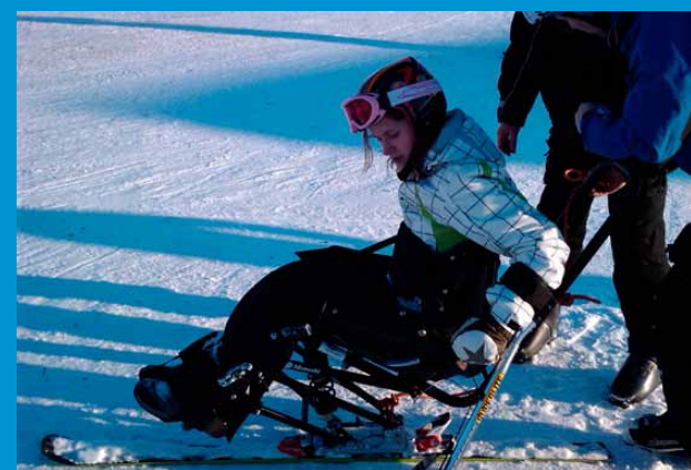
Med litt trening er det godt mulig å lære seg å kjøre sitski.