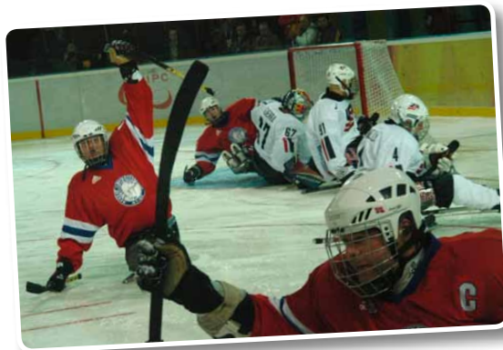
Får det norske kjelkehockeylandslaget mye å juble for i Paralympic som starter om tre uker?

Olympiatoppen har tatt ut følgende norske utøvere til Paralympic i Vancouver 12.- 21. mars: