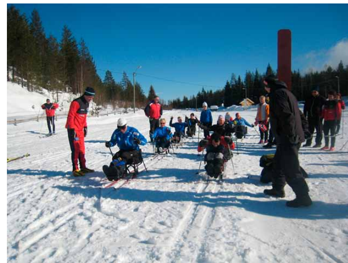
Rekruttering av funksjonshemmede i norsk idrett har vært gjenstand for debatt på Sportsanalyse.