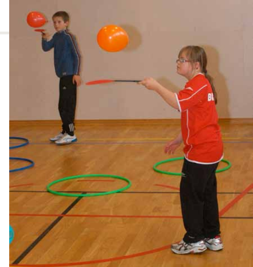
Rekruttering av funksjonshemmede til idretten blir ett av mange temaer under den nasjonale konferansen i november.