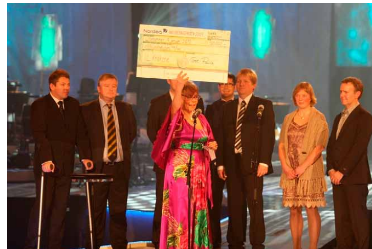
Idrettspresident Tove Paule delte ut Inkluderingsprisen under Idrettsgallaen i januar.

I tillegg har idrettslaget vært sentrale i utviklingsprosessen av den nye ishallen i Moss og sørget for at denne er godt tilrettelagt både i forhold til tilgjengelighet og idrettslig funksjon. Idrettslagets brede engasjement og måten de har jobbet helhetlig både i forhold til anlegg, markedsføring og rekruttering av utøvere, imponerte juryen.