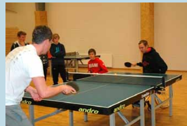
27. februar blir det mulig å prøve ut bordtennis i Kongsvinger.

17. april: Det 47. Ridderrennet (Beitostølen).